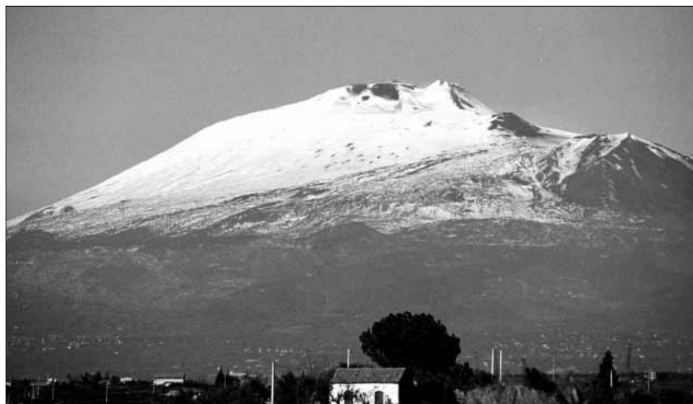
In alto, una visita guidata alle bocche del cratere principale. Qui sopra, una veduta del vulcano da Nicolosi

mostrato entusiasta dalla possibilità di far visitare ai suoi clienti, tra i quali numerosi italiani residenti all'estero, le più belle località nate all'ombra del famosissimo "gigante fumante".