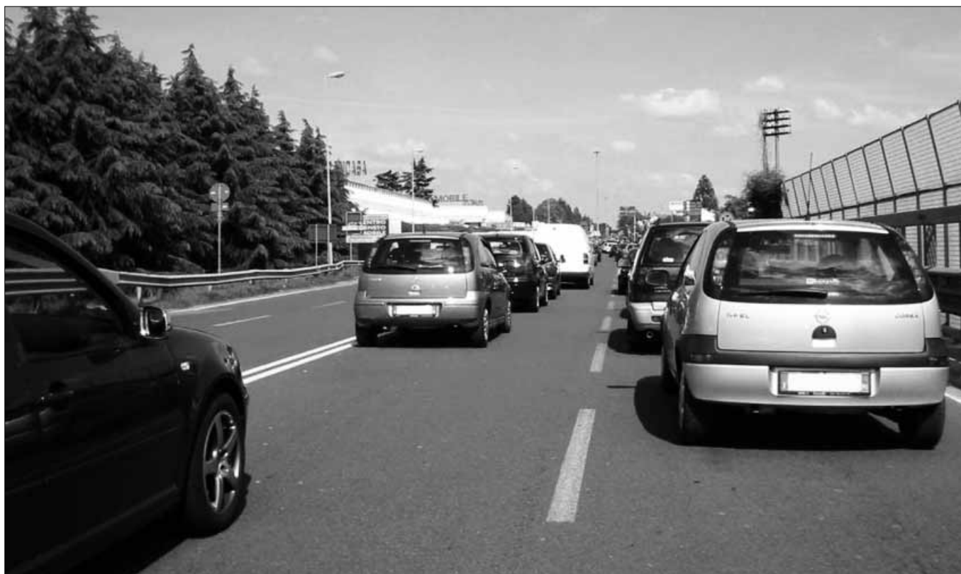
Strade della Sicilia

recupero dei siti industriali e dei terreni contaminati. E 240 milioni di euro per la prevenzione dei rischi.