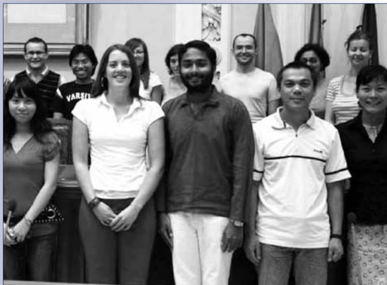
Giovani di tutto il mondo

L'individuazione dei candidati da avviare ai tirocini sarà effettuata in base alla rispondenza delle competenze, dei titoli posseduti e del curriculum al profilo richiesto dal datore di lavoro.