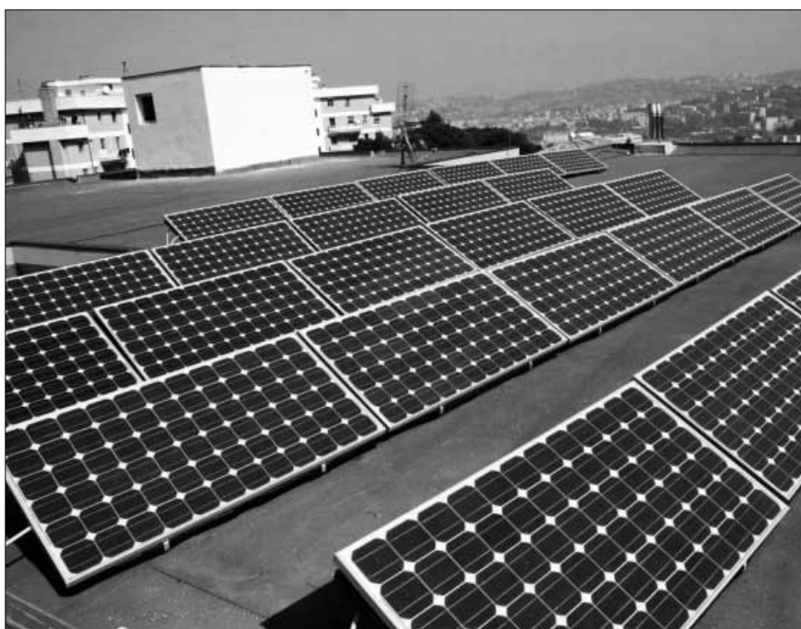
In alto, lo stabilimento della Sunel; qui sopra, i moduli fotovoltaici