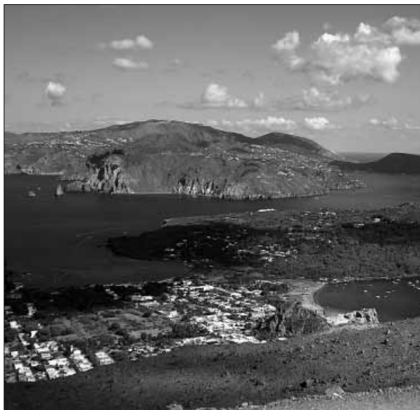
Immagini delle isole Eolie

Così - continua - nell'arco della corrente stagione estiva, abbiamo iniziato la cura e la valorizzazione di un lido balneare. Questo progetto - spiega Agnosto - ha già ottenuto un ottimo risultato, posto che, non solo siamo riusciti ad avviare