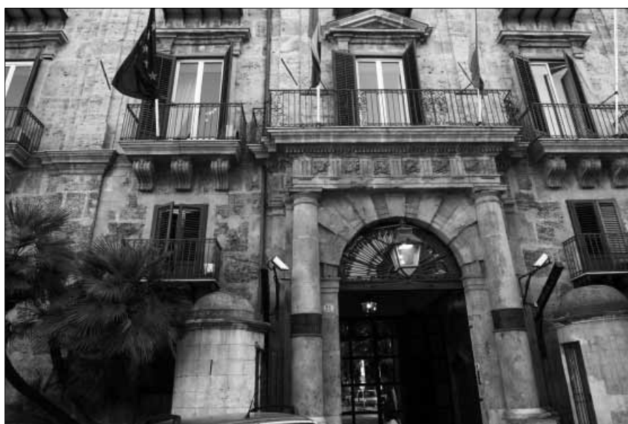
Palermo, Palazzo d'Orléans

tamento delle reti di trasporto dell'Isola. Con 430 milioni di euro circa si dovrebbe ultimare il