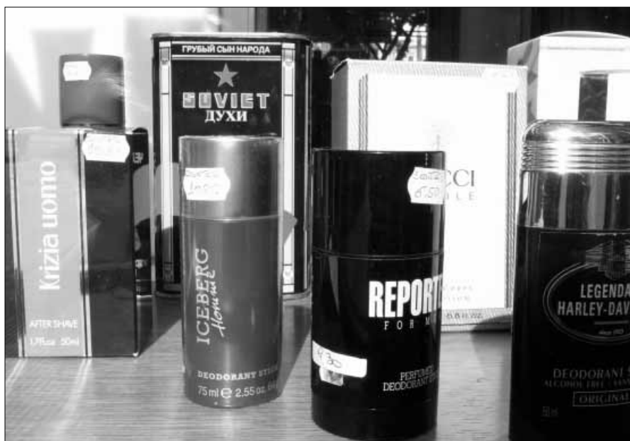
Prodotti di profumeria