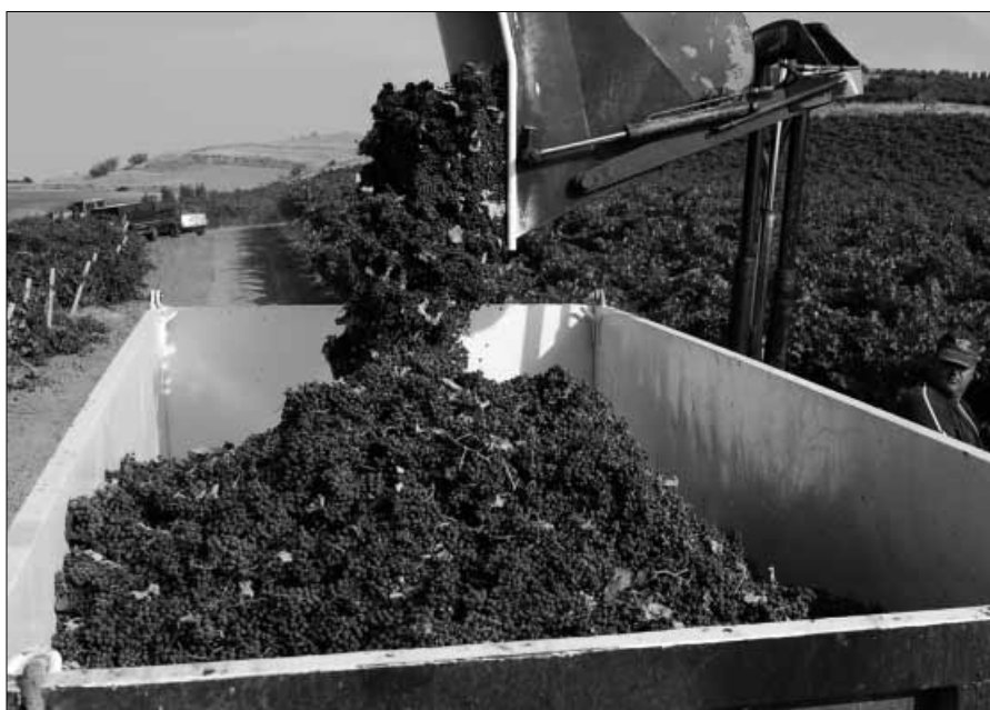
Alcune fasi della vendemmia in Sicilia

qualità. Ed è quella la strada da seguire, quella che punta ad un prodotto che possa essere apprezzato e competitivo sul mercato, che possa produrre e non assorbire ricchezza, come avvenuto ad esempio nei periodi di eccedenza».